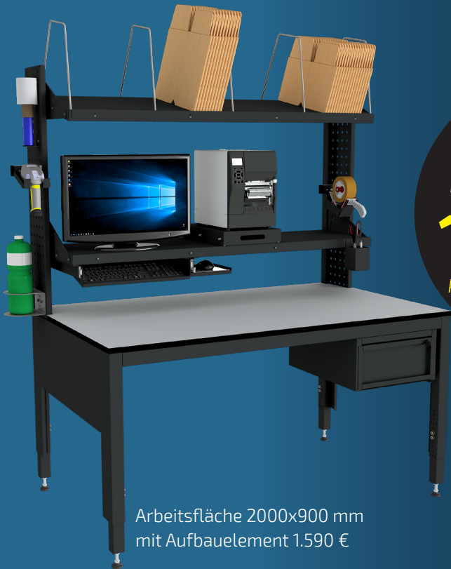
Arbeitsfläche 2000x900 mm mit Aufbauelement 1.590 €

Aus robustem Stahlblech gefertigt, bietet PackLine Smart eine lange Lebensdauer. Als Bausatz in zwei Größen mit oder ohne Etagenböden erhältlich, ist der Packtisch im Handumdrehen aufgebaut und einsatzbereit. Ein umfangreiches Zubehörprogramm rundet das Angebot ab.